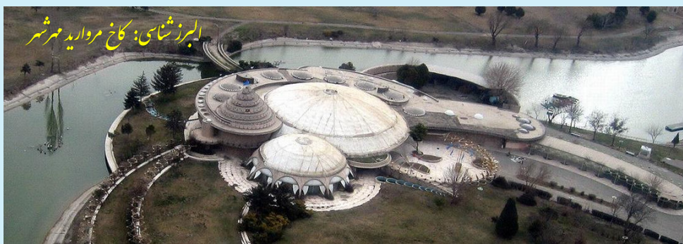
البرزشناسی: کاخ مروارید مهرشهر