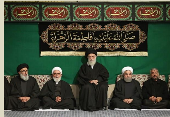
شهیدان و اولاد مظلوم ایشان پرداختند.